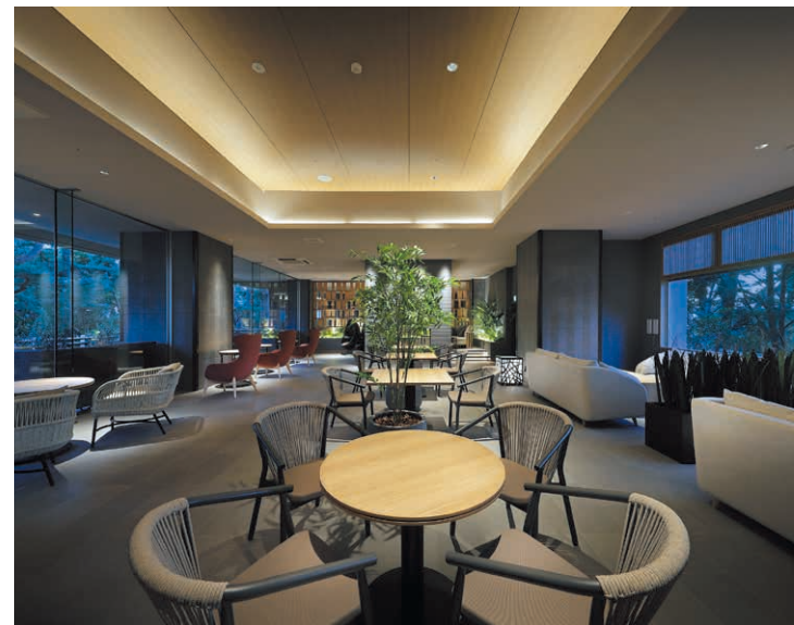
2023年3月に誕生したテラスリビング「風光」。宿を取り囲む安房の松原と一体になれるようなテラスリビングを配した空間。