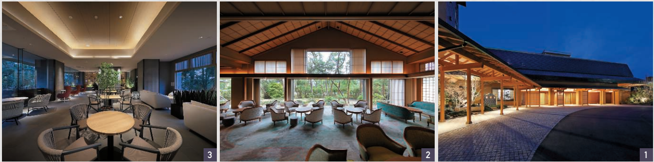
1 松林の中の数寄屋造りが目を引く、南房総の旅の拠点にも便利な湯宿。2 ゆったりとしたラウンジの外には松林に囲まれた庭園風景が広がる。3 新設されたテラスリビング「風光」は大人限定のフリーフロールウンジ(1名1泊ごと/2750円)。