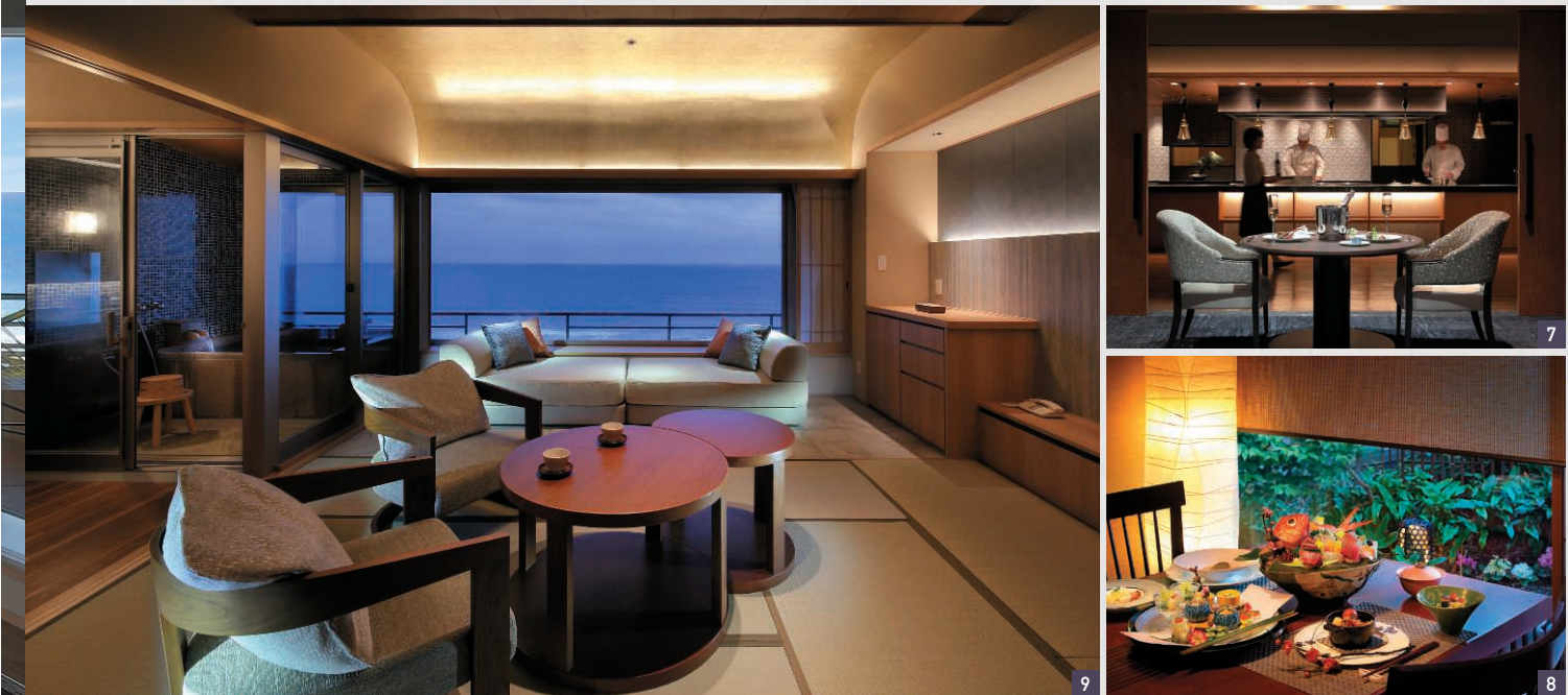
4 大海原に近い温泉ぶーろ「HARUKA」は水着や専用着衣で利用できる温泉プール。5 2つの大浴場「ときわの湯」と「みぎわの湯」は男女交替制で楽しめる。6 天然温泉に浸かりながら水平線を望む客室「特福室」の半露天風呂。7 板前ライブダイニング「MAIWAI」では、調理する様子を間近で見られる。8 四季折々に房総の山の幸、海の幸を会席で味わえる個室料亭「よしだや」。9 テラス風リビングタイプの温泉半露天風呂付き和洋室は海をより身近に感じる設え。10 新たな客室「特福室」は1日1組限定。目の前に広がる絶景を贅沢に独占できる。